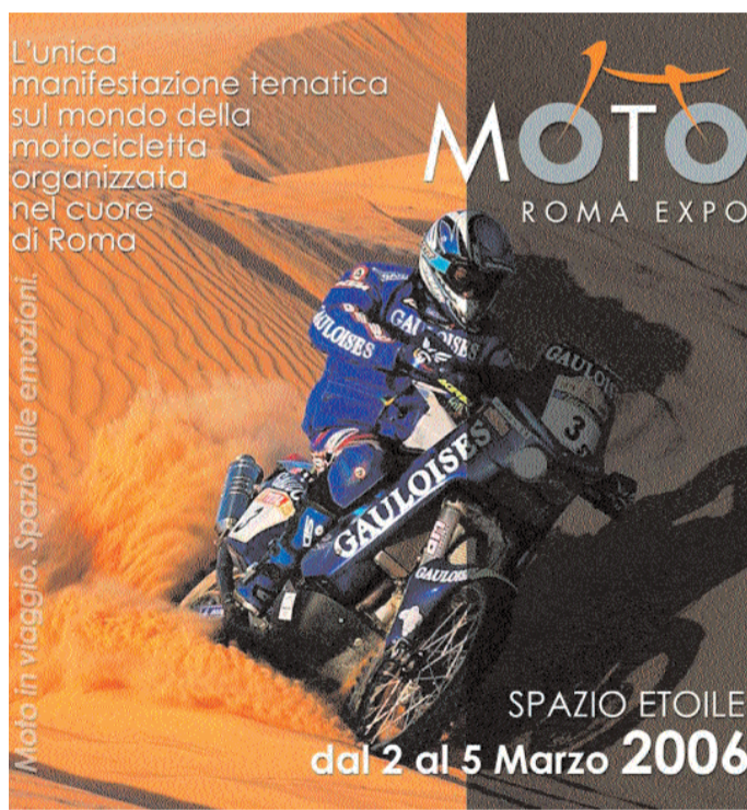
Moto in viaggio. Spazio alle emozioni.